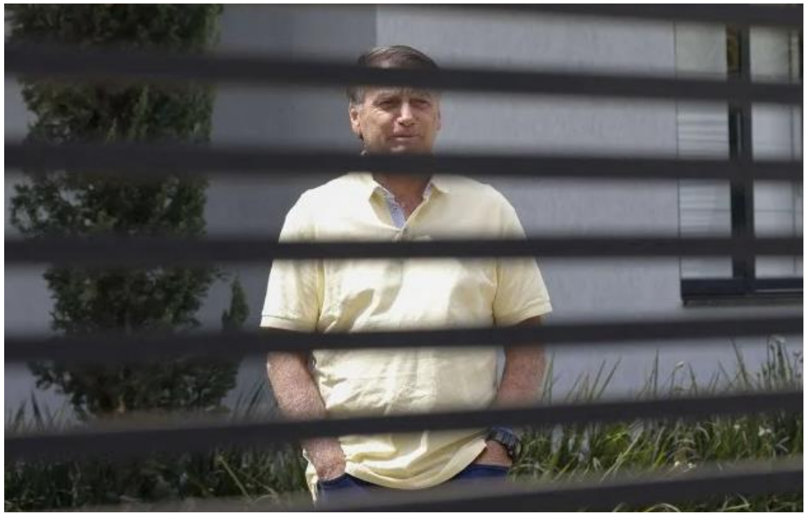
Foto de Jair Messias Bolsonaro em sua residência no Jardim Botânico, durante sua prisão domiciliar.

A reação política não tardou. Aliados do ex-presidente tentaram avançar no Congresso com projetos que, direta ou indiretamente, poderiam reduzir sua pena. A resposta do Palácio do Planalto foi imediata: o presidente Luiz Inácio Lula da Silva anunciou publicamente que vetaria qualquer iniciativa legislativa com esse objetivo. A declaração, repercutida pela agência Reuters , não apenas reafirmou a posição do Executivo como também escancarou o clima de confronto entre os Poderes em torno de um caso que se tornou símbolo da defesa da contestação da democracia brasileira.