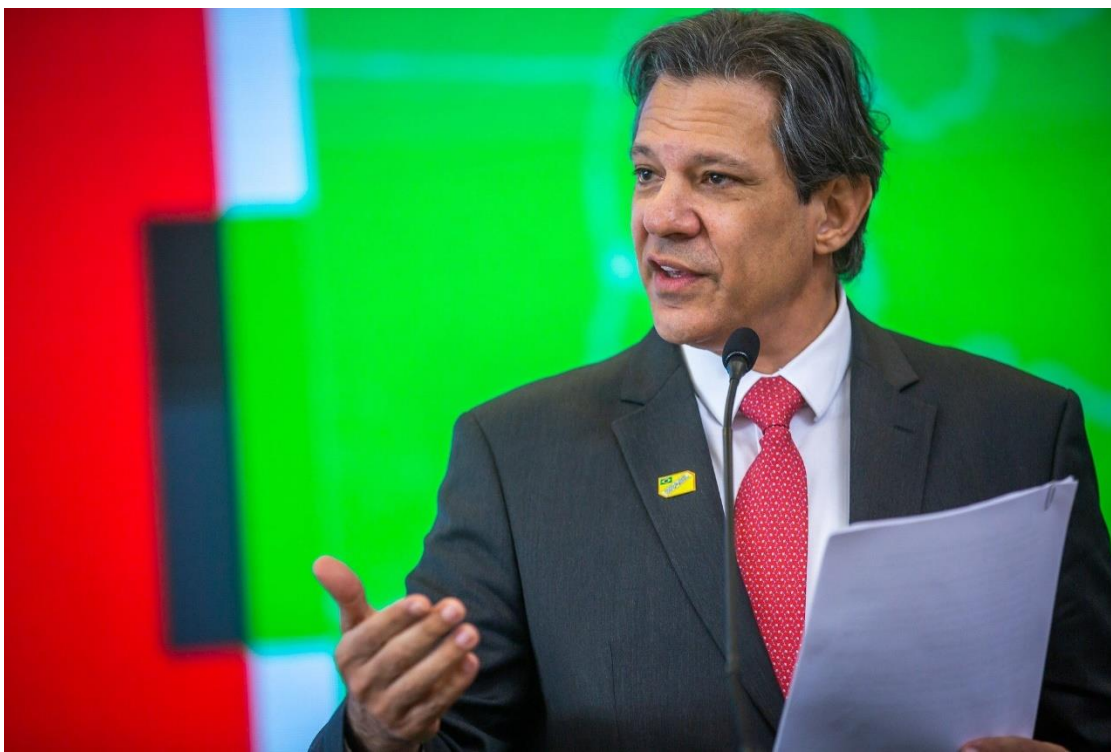
O ministro da Fazenda, Fernando Haddad

Além disso, o Brasil registrou recorde de investimentos estrangeiros diretos. Nota-se, nesse sentido, que uma pesquisa da McKinsey indica um crescimento absurdo de 67% no volume desse capital entre maio de 2022 e maio de 2025, significativamente acima da média mundial de 24%, em comparação com o período entre 2015 e 2019. Os números são, sim, impressionantes. Foram, em geral, impulsionados pelos contratos bilionários que o país logrou concluir, incluindo projetos para a construção de uma usina de hidrogênio verde no Ceará, visto com bons olhos pelo mercado. Além desse, há também projetos de extração de petróleo e gás na Bacia de Campos. No entanto, isso contrasta com a realidade de estagnação do crescimento econômico do país, indicando que há outros fatores que atuam como limitantes disso.