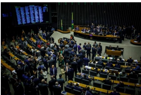
O plenário da Câmara dos Deputados – Foto: Brenno Carvalho/Agência O Globo

No centro desse tabuleiro continua a figura de Jair Bolsonaro. Mesmo fora do poder e agora cumprindo pena o ex-presidente permanece como eixo gravitacional do debate público. Em setembro, Bolsonaro foi condenado a mais de 27 anos de prisão por participação em um plano de ruptura institucional após as eleições de 2022. No último mês, o tema voltou às manchetes com sua internação hospitalar para uma cirurgia de hérnia, realizada sob autorização judicial, mas sem qualquer flexibilização do regime de cumprimento de pena. O episódio reacendeu debates sobre privilégios, legalidade e o tratamento dado a figuras políticas condenadas, amplamente cobertos pela imprensa internacional, como a Associated Press .