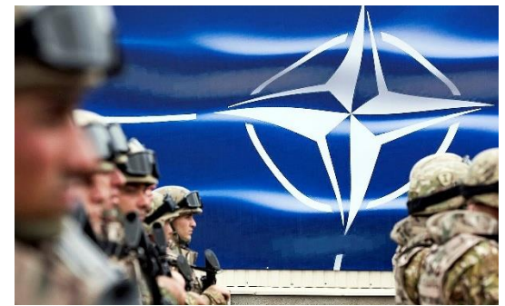
Bandeira de OTAN.

No dia 25 de dezembro de 2025, um cabo submarino entre a Finlândia e a Estônia foi supostamente sabotado por um navio russo, gerando alertas na OTAN e demonstrando a continuidade dos ataques de guerra híbrida a infraestruturas mistas dos países da OTAN atribuídas à Rússia. As guerras híbridas e ataques a infraestruturas mistas são fatores importantíssimos para a guerra moderna, principalmente por prejudicar o preparo militar e por não haver certeza do país atacante, sendo uma ferramenta que atravessa contenções do sistema internacional.