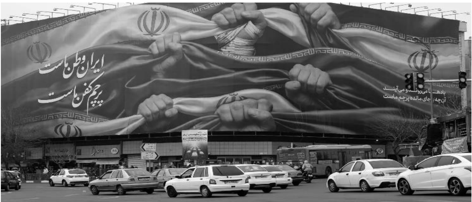
Propaganda do regime dos aiatolás com a mensagem "O Irã é nossa pátria" em Teerã.

Enquanto a guerra híbrida escala na Europa, no Oriente Médio o realismo assume sua forma mais explícita. A invasão do Líbano em 2024 foi um presságio de uma evolução dos conflitos por vir, misturando guerras por procuração e intervenções militares em países estrangeiros, com Israel invadindo um país soberano em busca do proxy iraniano Hezbollah. Em 2025, tanto Israel quanto seu patrono geopolítico, os Estados Unidos, realizaram bombardeios no Irã contra instalações nucleares. O Irã retaliou com um ataque massivo de drones e mísseis,