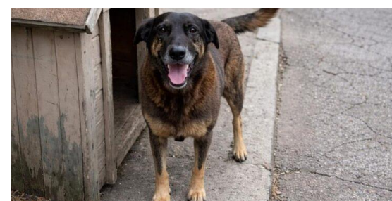
Foto tirado do cão Orelha.

Em síntese, o Brasil de janeiro de 2026 revela um país em permanente estado de debate e conflito político. A antecipação do clima eleitoral, a fragilidade das mediações institucionais e a centralidade das redes digitais produzem um ambiente no qual crises econômicas, protestos de rua e episódios de forte apelo emocional se entrelaçam. O desafio das instituições democráticas será absorver essas tensões sem perder estabilidade, em um contexto no qual a política segue avançando muitas vezes de forma ruidosa sobre todos os aspectos da vida pública.