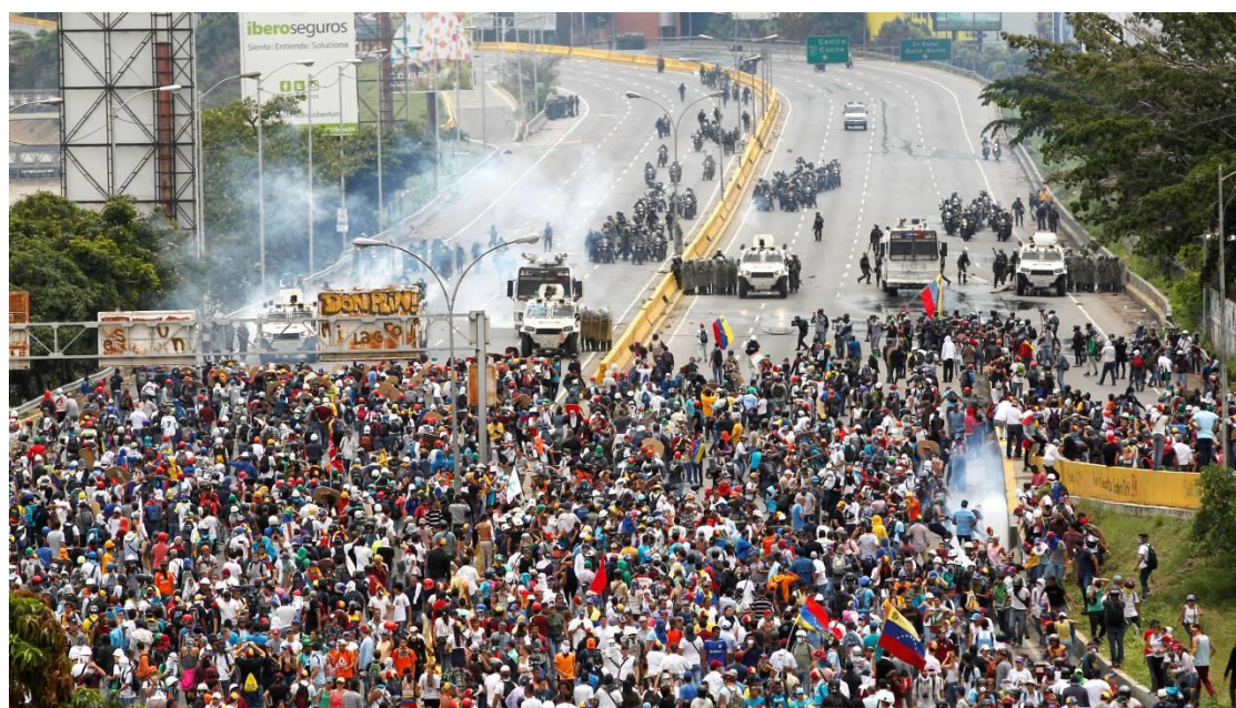
Manifestantes da oposição ao Presidente Nicolás Maduro entram em confronto com a polícia durante protesto em Caracas, na Venezuela - 03/05/2017.