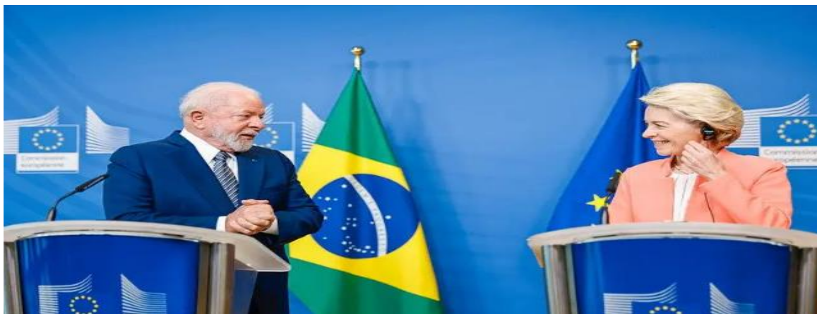
cúpula de Montevideu durante negociações

Mesmo antes de entrar em vigor, é importante destacar que o acordo Mercosul-EU já começou, especialmente a partir desse ano, a surtir os seus primeiros efeitos nas economias nacionais. Embora não tenha sido ratificado, o que não influenciou significativamente os investimentos projetados a curto prazo, ele sinalizou maturidade institucional do bloco mais ao sul, fazendo os investidores enxergarem menos riscos para se projetar investimentos a longo prazo, especialmente pondo a ratificação do tratado como condicionante.