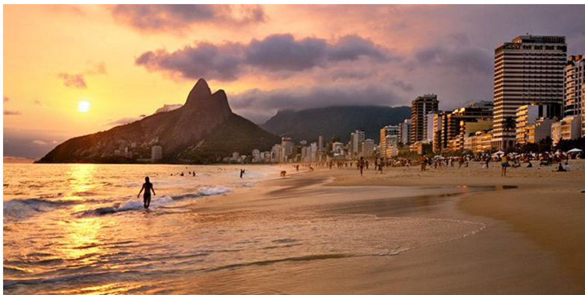
Foto retirada da praia Ipanema.

Mesmo que nunca tenha sido tecnicamente quebrada, ela já foi, sim, alvo de tensões que puseram-na à prova. Talvez a mais desafiadora tenha sido esse dilema trazido por