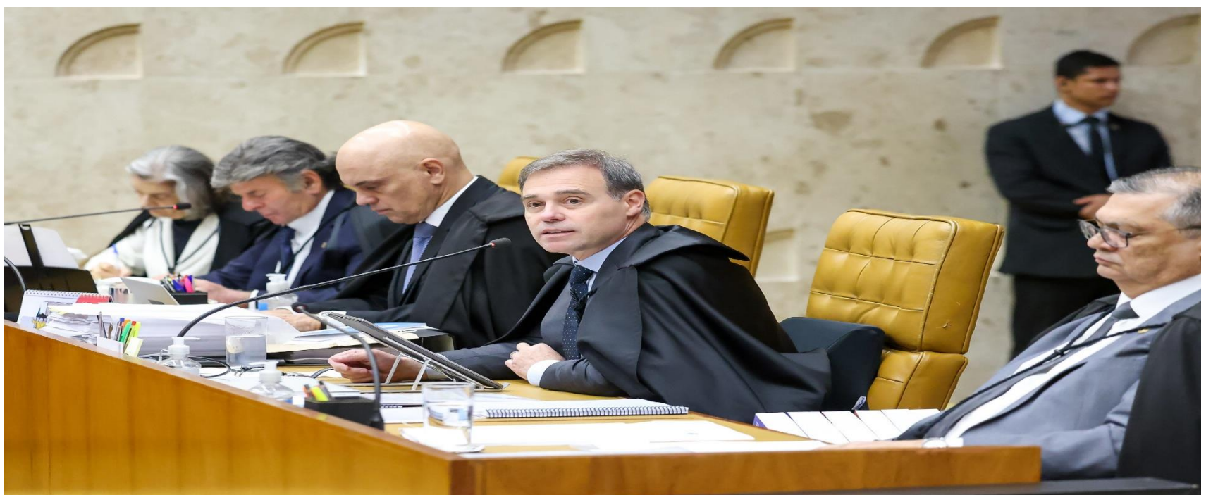
Ministro André Mendonça em sessão plenária do STF.

O Congresso tende a assumir papel ainda mais central em 2026 por duas razões principais. A primeira é o calendário eleitoral, que reduz a janela para aprovação de projetos estruturais. A segunda é o fortalecimento do chamado “centrão”, bloco parlamentar cuja influência cresce em períodos de disputa política aberta.