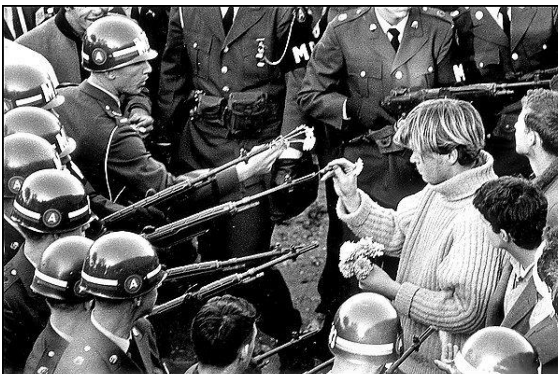
Fotografia “flower power” de Bernie Boston.