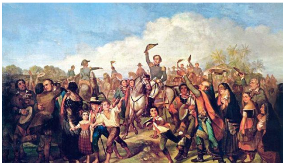
Proclamação da Independência, de François-René Moreaux (1844)