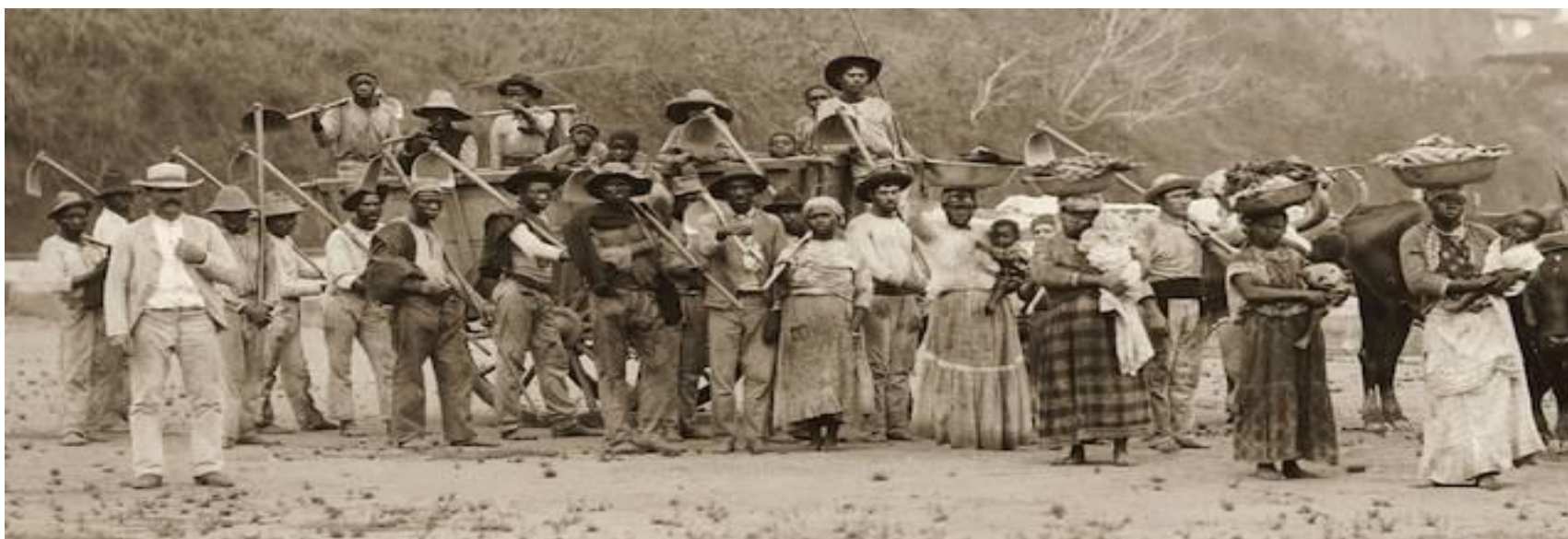
Foto- Marc Ferrez, Instituto Moreira Salles, Vale do Paraíba 1885. Imagem disponível em: https://www.geledes.org.br/alfomriados-negros-ainda-foram-explorados-como-escravos/

A resposta do Estado para essa crise foi a intensificação do uso e da dependência da mão de obra cativa. Um dos fatores mantenedores da escravidão no Brasil, nesse sentido, pode ter sido a ação distorcida do Estado sobre o sistema de preços e, em última instância, a alocação de recursos, e a Fundação de Ipanema não se isentou disso. Entre 1835 e 1842, estimativas sugerem a seguinte composição da força de trabalho: 174 escravos, 144 africanos livres e somente 51 trabalhadores europeus. Isso sugere que 60% ou mais da força de trabalho da Fundação era composta por operários não-livres.